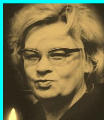
ANNA KAMIŃSKA wybór wierszy

05.11.2022, g. 17:00 - Muzeum Tradycji Kolejowej w Węgorzewie - ul. Stefana Jaracza 4 -