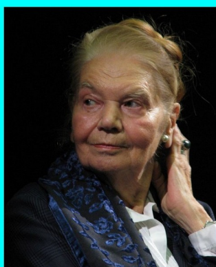
JULIA HARTWIG wybór wierszy

Z radością przyjęła śmierć. Prosi bliskich o przyjęcie jej śmierci z radością.”